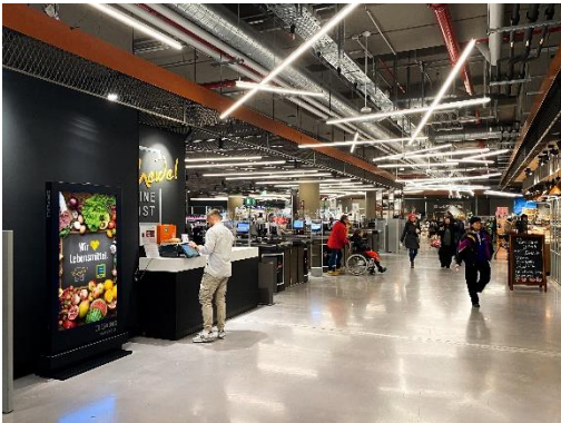
Indoor-DCLP, Zurheide, Standort Berliner Allee, Düsseldorf