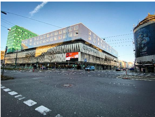
Zurheide, Außenansicht, Berliner Allee, Düsseldorf