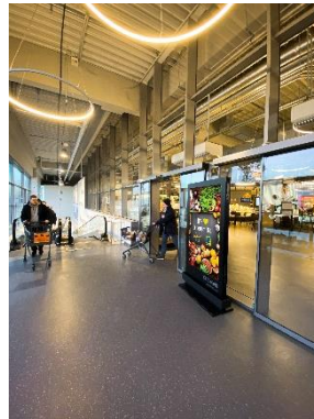
Indoor-DCLP, Zurheide, Standort Leipziger Straße, Düsseldorf, Foto: DIGOOH Media