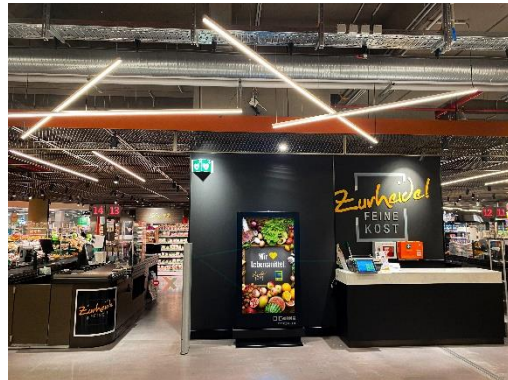
Indoor-DCLP, Zurheide, Standort Berliner Allee, Düsseldorf, Foto: DIGOOH Media